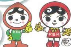
人KENまもる君 人KENあゆみちゃん 人権イメージキャラクター