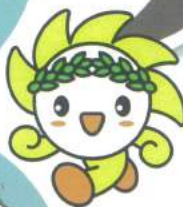
人権かがやきくん